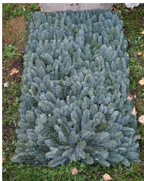
Schema 2E // Tanne blau