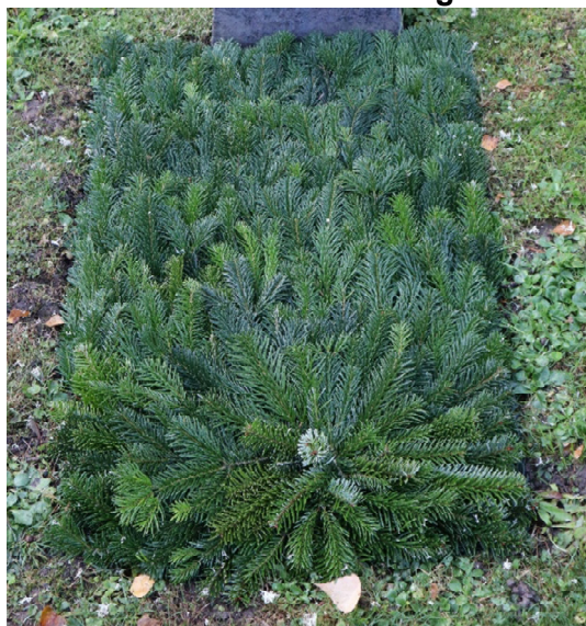
Schema 1E // Tanne grün

Allerheiligen: Ein Heidekraut ist in der Zusammensetzung jedes Schemas vorgesehen