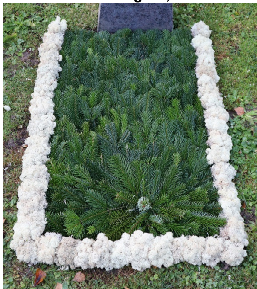
Schema 1EB // Tanne grün, Moos Bordüren