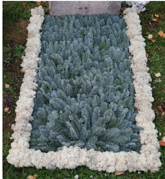
Schema 2EB // Tanne blau, Moos Bordüren